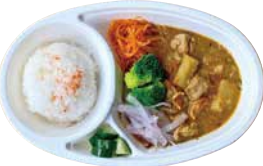
スパイスカレー 700 Spicy Curry [with Rice]