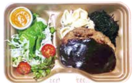
ハンバーグ弁当 700 Hamburger Bento [with Rice]