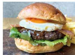
ベーコン月見バーガー 750 Bacon Egg Burger