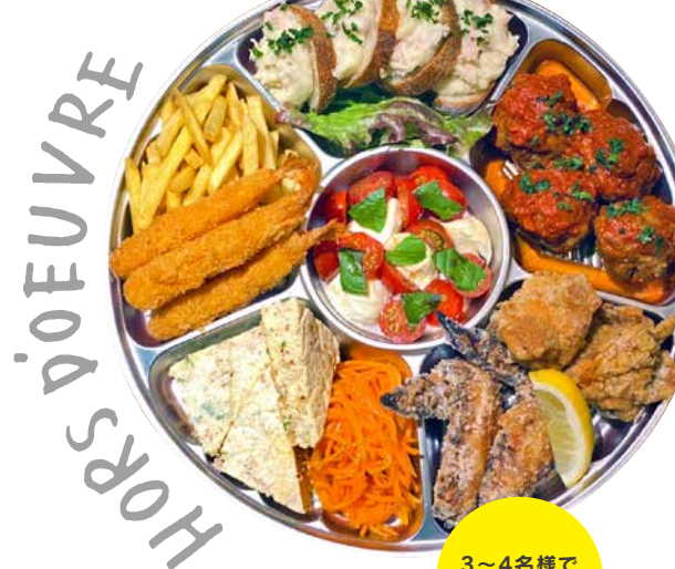
ファミリーパック 3~4名様分 3500