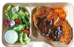
ロースカツ弁当 600 Pork Cutlet [with Rice]