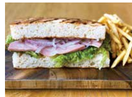
パニーニサンド 750 Panini Sandwich