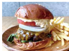
MUバーガー 900 MU Burger