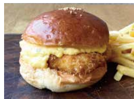
フィッシュバーガー 600 Fish Burger