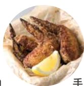
手羽先 650 唐揚げ Fried Chicken wings