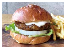
てりやきバーガー 600 Teriyaki Burger