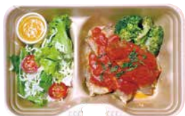
日替わり弁当 500 Today's Bento [with Rice] *写真はイメージです