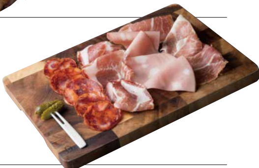
シャルキュトリミスト 1200 3種類のハムを盛り合わせに!