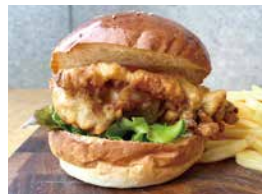
フライドチキンバーガー 550 Fried Chicken Burger