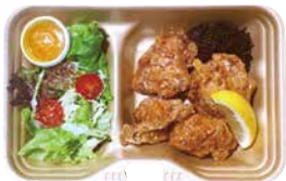
唐揚げ弁当 500 Fried Chicken Bento [with Rice]